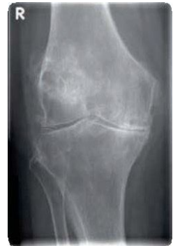
artrose van de knie

Doordat de aangetaste gewrichtsoppervlakken ruw zijn, gaat de knie niet meer soepel bewegen. Bovendien lokt slijtage van de knie een ontstekingsreactie uit. Hierdoor ontstaat pijn en zwelling. Eens het kraakbeen aangetast is, kan het niet opnieuw door het lichaam worden aangemaakt.